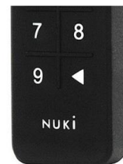
Cierre la puerta de entrada presionando el triángulo

Cuando salga de la casa, siempre cierre la casa con llave (no se limite a cerrarla). Cierra la casa presionando la flecha / triángulo en la parte inferior derecha del teclado. Espera un minuto. Oirá girar la cerradura.