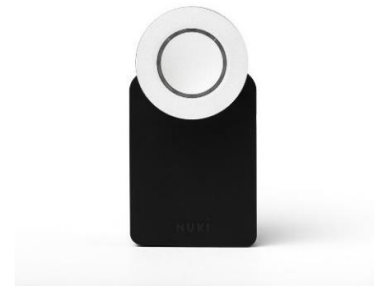
NUKI- Smart Lock en el interior de la puerta de entrada

Cuando esté en la casa, simplemente puede abrir la puerta con la manija. Puede bloquear y desbloquear la puerta desde el interior girando manualmente la perilla plateada del NUKI. NUNCA presione el botón. Puede dar lugar a errores.