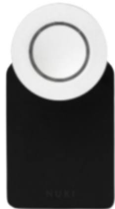
NUKI- Smart Lock aan de binnenzijde van de deur

De voordeur van Villa Vista wordt bediend door een Nuki - Smart Lock (zie foto). Wanneer je in het huis bent, kun je de deur gewoon openen met behulp van de hendel. Je kunt de deur aan de binnenzijde vergrendelen (voor bijvoorbeeld de nacht) en ontgrendelen door de zilverkleurige knop van de NUKI handmatig te draaien. Druk NOOIT op de knop. Het kan tot fouten leiden.