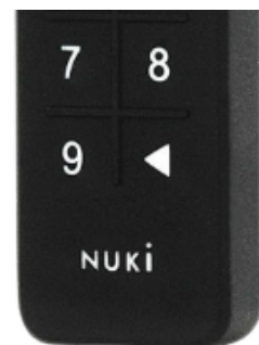
Keypad aan de buitenzijde

Als je het huis verlaat, vergrendel dan altijd het huis (niet alleen dicht trekken). Je vergrendelt het huis door te drukken op het pijltje / driehoekje, rechtsonder van de keypad. Wacht heel even. je hoort het slot draaien, de deur is vergrendeld.